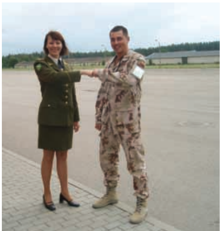
Kartu su kolege po susitikimo su PAG karių artimaisiais

Karas vertinamas kaip žmogiškų klaidų sangrūda. Ten visiškai kitoks gyvenimas nei mūsų kasdienybė. Kai vienaip ar kitaip esi su juo susijęs – ieškai būdų išlikti ir išsaugoti tai, ką turi brangiausia, vertingiausia.