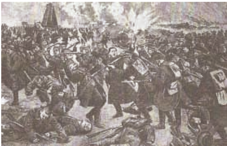
Mūšis prie Radviliškio malūno dailininko Rudolfo akimis

Vienoje iš užrašytų to meto istorijų pasakojama, kaip lietuviai užgrobė bermontininkų garvežį, prieš tai susprogdinę tiltą. Iškilė dilema: kaip garvežiu nuvažiuoti į Radviliškį, jei tilto nebėra. Iš rąstų ir senų pabėgių buvo sumontuotas šiokia tokia pravaža, kuria, stipriai siūbuodamas, garvežys sėkmingai prariedėjo.