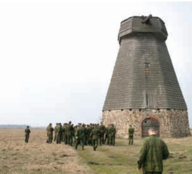
Spėjama, kad prie šio malūno vyko mūšis su bermontininkais