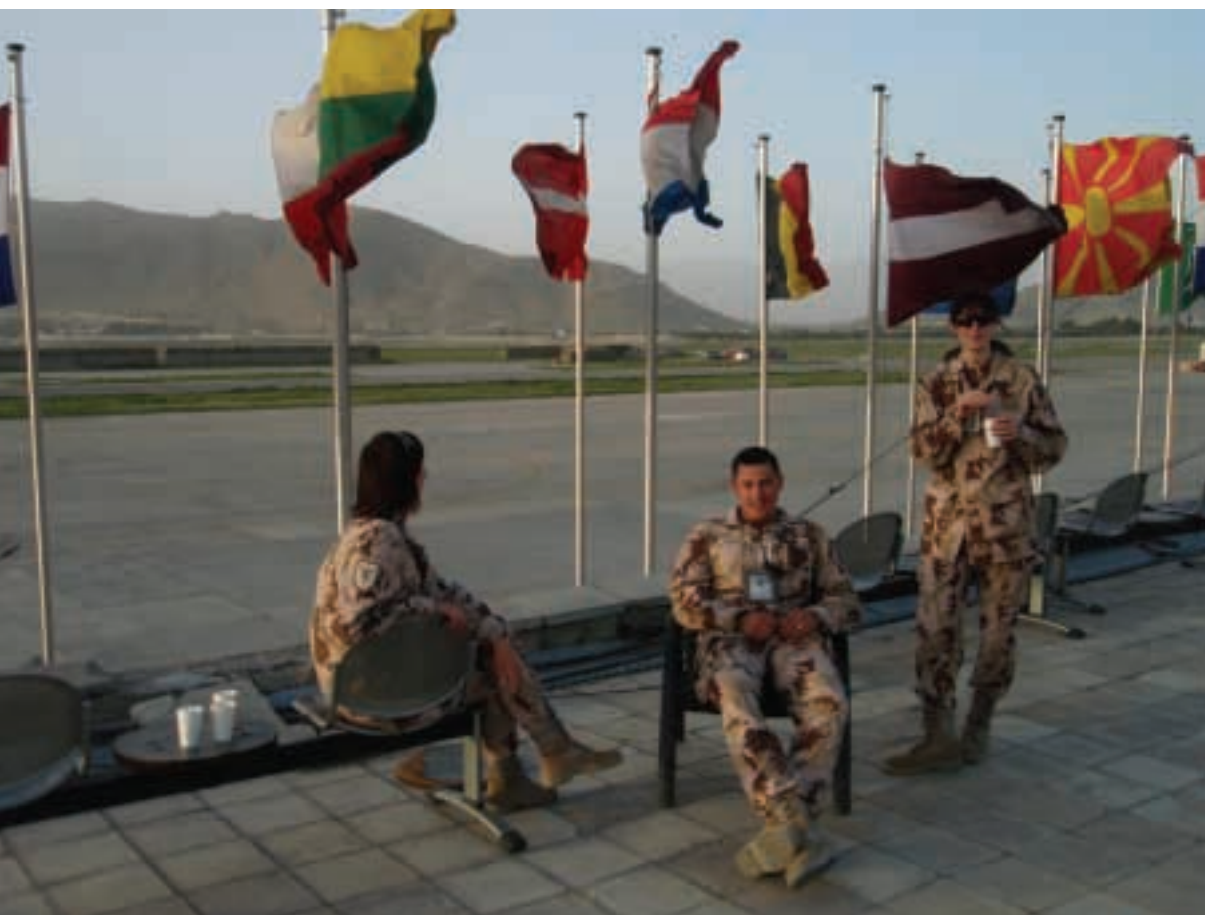
Kabulo oro uosto stogas. Atspalaidavimo akimirka žvelgiant į kylančius ir besileidžiančius lėktuvus.

Tačiau vienas didžiausių priešų – ne sukilėliai, kartais ginkluoti tik akmenimis, ne atšiauri gamta, bet nuolatinis nerimas ir įtampa, šeimos ir artimųjų ilgesys.