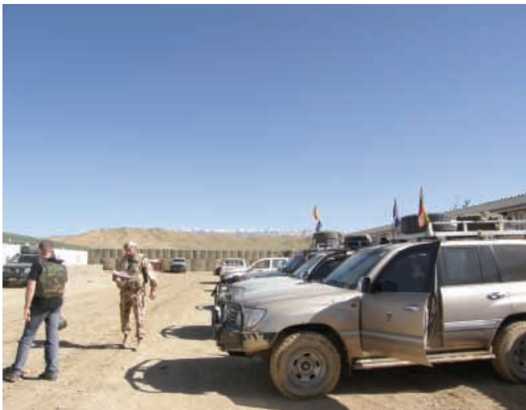
Lietuvos vadovaujamos Goro provincijos atkūrimo grupės stovykla Čagčarane – 2270 metrų virš jūros lygio