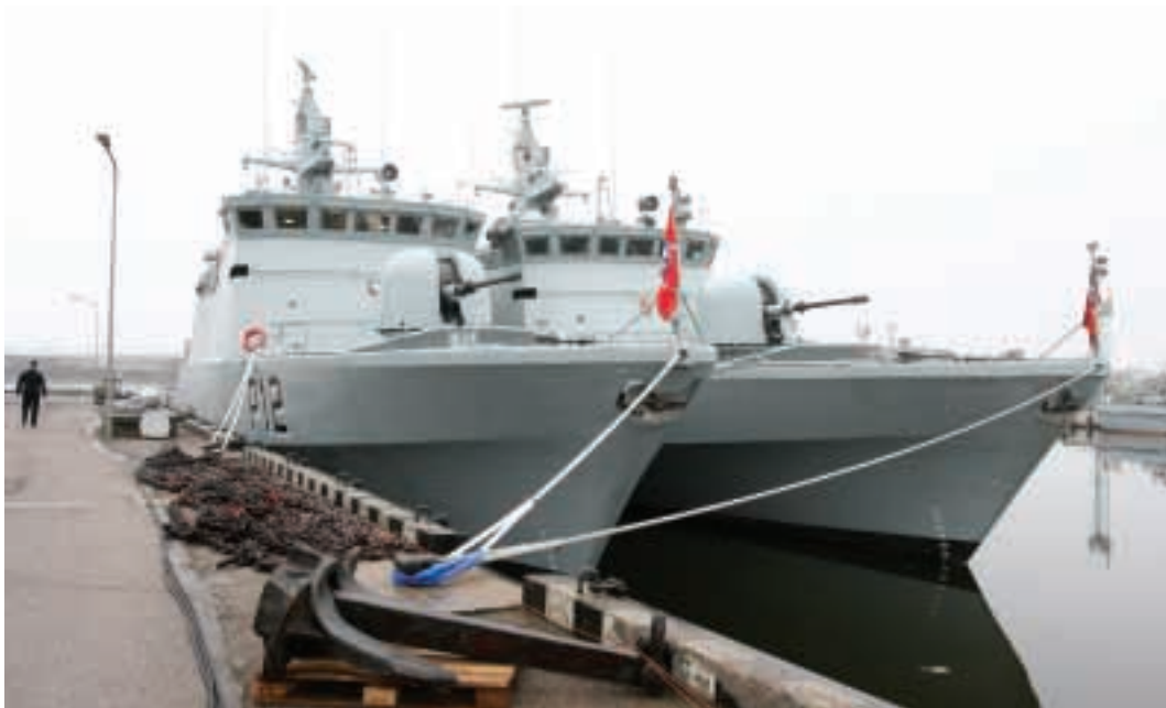
Kariškiai stebėjo, kaip Danijoje buvo atliekama laivo modernizacija

išeiti į jūrą, kaip elgtis, jei kiltų gaisras ar kitas incidentas, taip pat susipažino, kaip keičiamos sargybos jūroje, mokėsi kovinių parengčių. Visa tai reikalinga, kad įgula susipažintų su laivu, pasiruoštų jį valdyti, atsitikus incidentui, sugebėtų pataisyti įvairius gedimus. Mokymų reikėjo ir todėl, kad galėtume savarankiškai grįžti į Lietuvą.