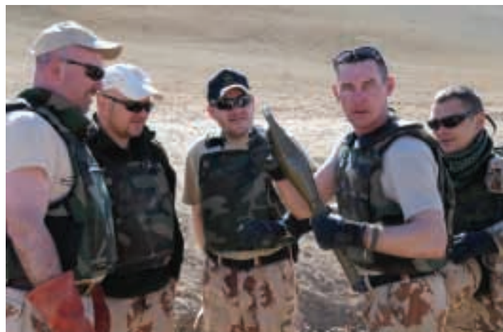
Prieš sprogmenų sunaikinimą...

– Afganistane naikino me dviejų tipų sprogmenis – karo laikų liekanas, kaip ir Lietuvoje, ir teroristų pagamintus sprogstamuosius užtaisus. Per pusės metų misiją nukenksminome tris pakelės bombas. Tuo tarpu užminuotų automobilių mums matyti neteko. Savadarbius teroristų užtaisus aptiko vietos teisėsaugos pareigūnai ir pranešė mums. Jos buvo padėtos kalnuose.