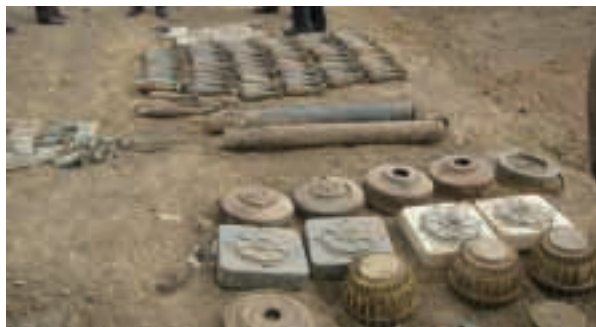
Sprogmenis sunaikinimui perdavė vietinė valdžia

– Gana dažnai jums tenka nukenksminti ir Lietuvoje randamus karo laikų sprogmenis. Tačiau išminavimo darbai Lietuvoje ir Afganistane – skirtingi?