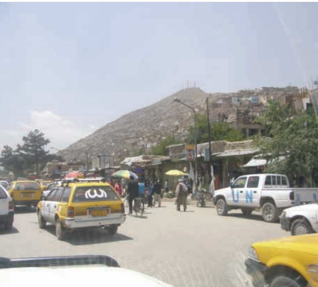
Judrios Kabulo gatvės