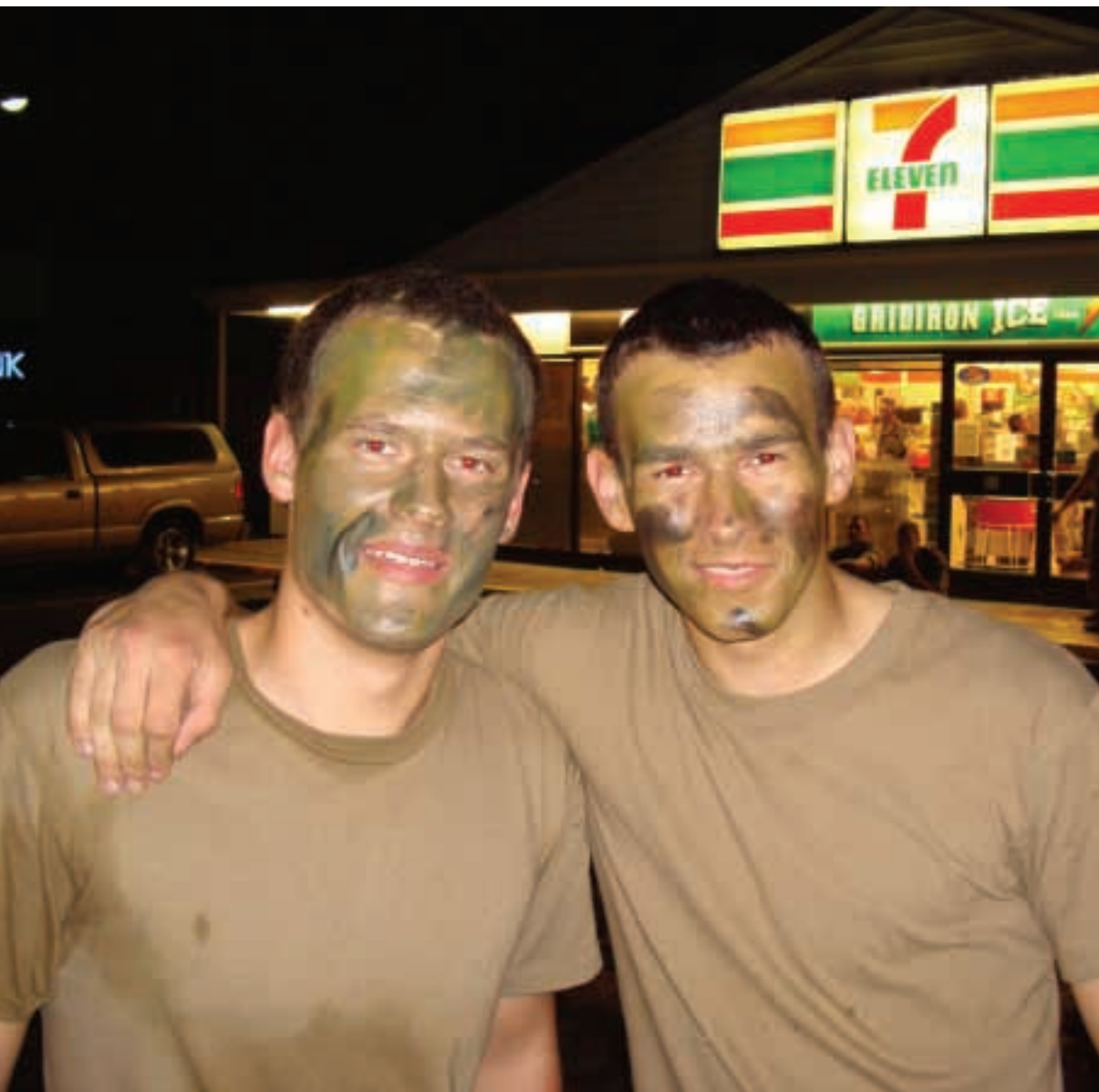
Su bendramoksliau. Kariškai nusigrimavę.

padaryti tik nakčiai, tad Vytenis skirtomis valandomis mieliau mokydavosi bibliotekoje.