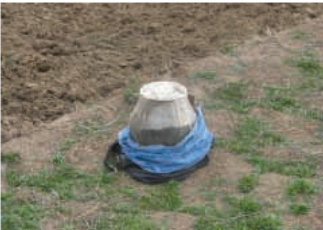
Rasta pakelės bomba

– Pats įvairiausias. Į vidų būna pridėta daug elektronikos prietaisų, veidrodžio šukių, degtukų, akumuliatorių, gilzių nuo šovinių, net klijų pakuootę kažkada mačiau. Atvirai tariant, nežinau, kam ji buvo reikalinga.