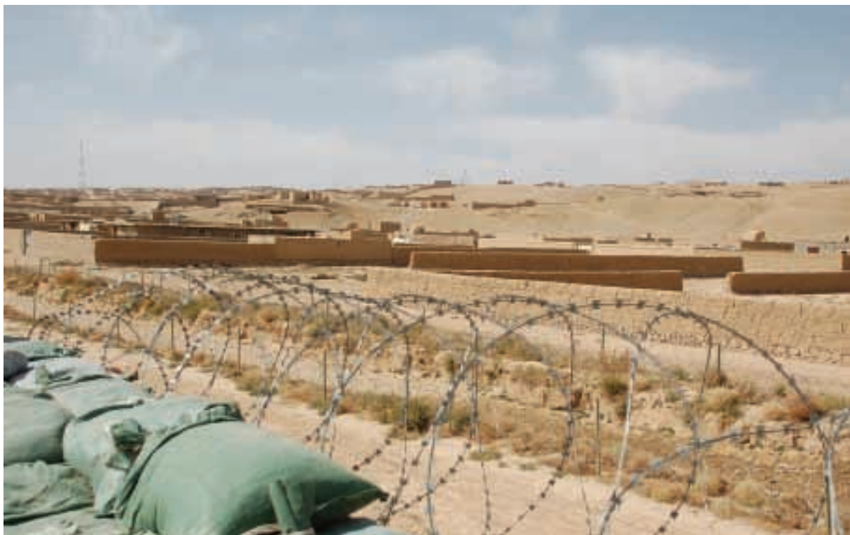
Lietuvos vadovaujamos Provincijos atkūrimo grupės stovyklą Čagčarane (Afganistano Goro provincija) supa Mėnulį ar dykumą primenantis peizažas.

Visą būrį sudaro apie 200 žmonių, tarp jų yra dešimt moterų. Tarp aptarnaujančio personalo galima pamatyti atvykėlių iš tokių egzotiškų šalių, kaip Filipinai ir Šri Lanka.