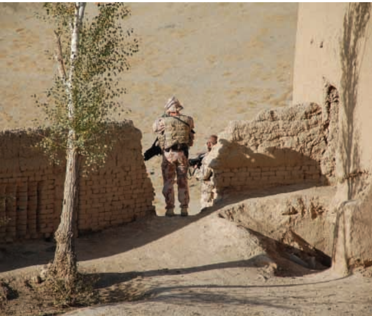
Provincijos atkūrimo grupėje tarnaujantys kariai saugo iš Lietuvos atvykusius svečius

Birželio 1-ąją keli lietuvių ir kroatų kariai praleido visą anglų kalbos pamoką pagrindinėje Čagčarano mokykloje. Į Sultono Saladino mokyklą jie nusprendė atvykti girdėdami daugybę gyventojų klausimų apie jų veiklą, ypatingą susidomėjimą reikšdami lietuviais. Aktyviausi iš daugiau nei 50 vaikų, dalyvavusių pamokose, gavo po simbolinę dovanėlę. Savo ruožtu moksleiviai mokė svečius dari kalbos.