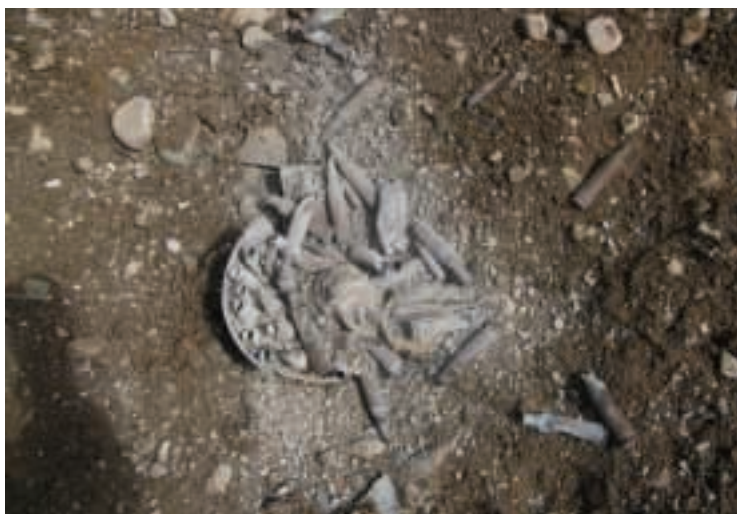
Pakelės bomba po neutralizavimo

– Kiek Afganistane teko sunaikinti senų ir likusių nuo karo sprogmenų? Ir ar jie yra ne tokie pavojingi?