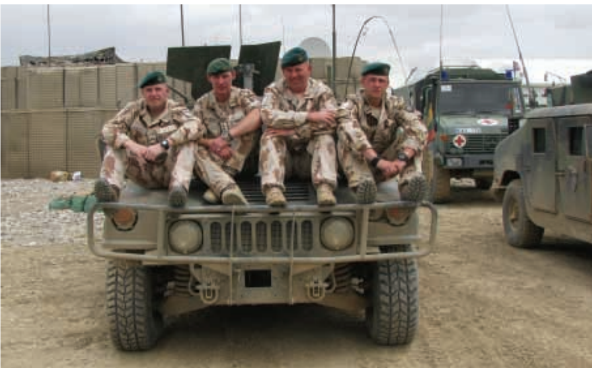
Afganistano Goro provincijos atkūrimo grupės 8-tasis išminavimo poskyris

– Keistas jausmas. Tarsi kažkas pereitų per kūną. Mes labai aiškiai suvokiame, kad esame čia, Afganistane, kad tai – jau ne pratybos, ne mokymai. Ir kad antros galimybės nebus. Visa reikia padaryti pirmuoju bandymu. Afganistane nuolatos dirba keturi mūsų išminuotojai, keturiese buvome ir mes. Tarpusavyje tariamės, ką ir kaip daryti, svarstome įvairius variantus. Svarbiausia, ko reikia tokiomis akimirkomis, – šalto proto ir nepasiduoti jokioms emocijoms.